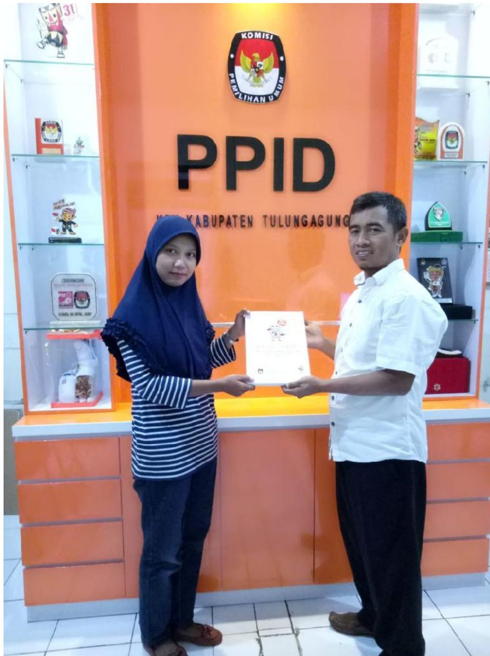
Ruang DESK PPID