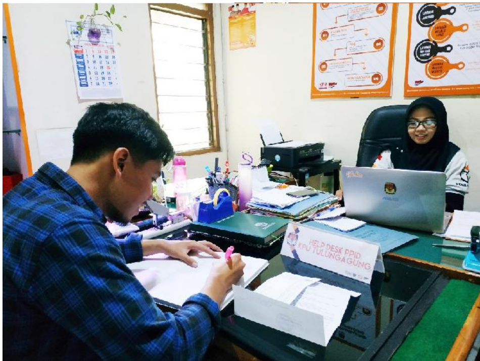
Petugas Desh PPID Sedang melayani permohonan informasi dari hasiswa dan mahasiswi